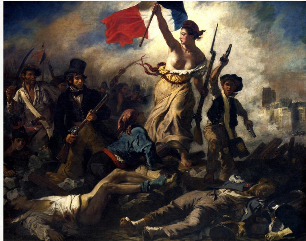
Ferdinand Victor Eugène Delacroix