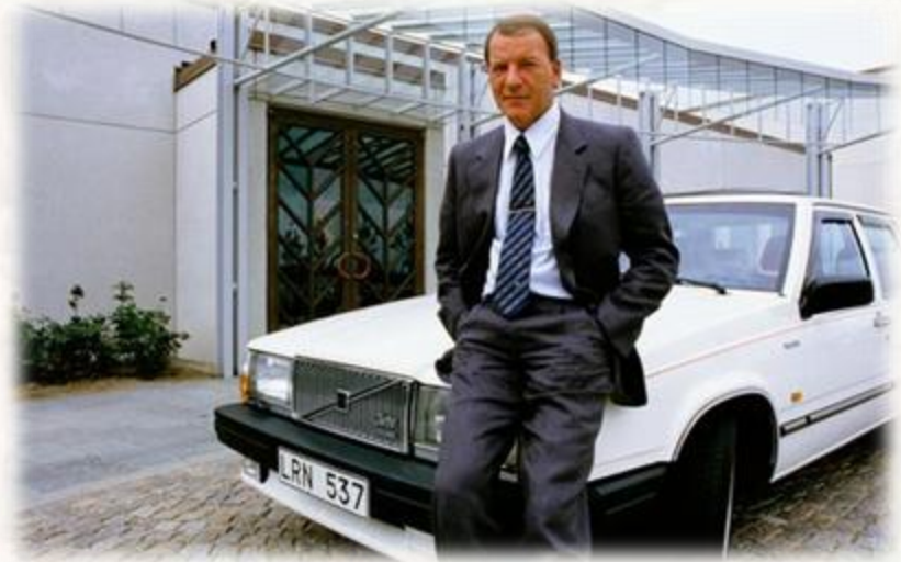
Pehr Gustaf Gyllenhammar, CEO of Volvo