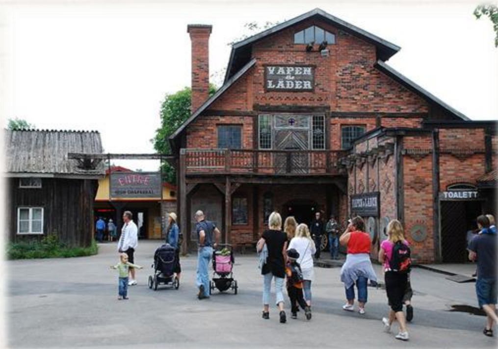
High Chaparral, Småland, Szwecja

https://www.youtube.com/watch?v=EyDMeofiCMM