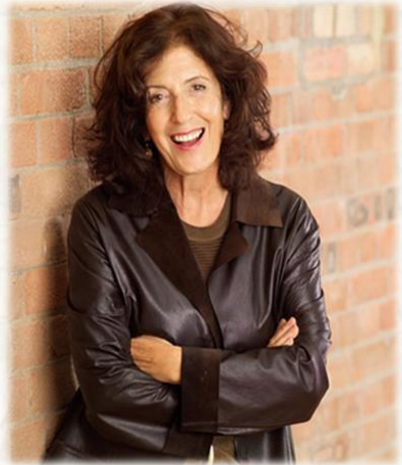
Anita Roddick. Body Shop