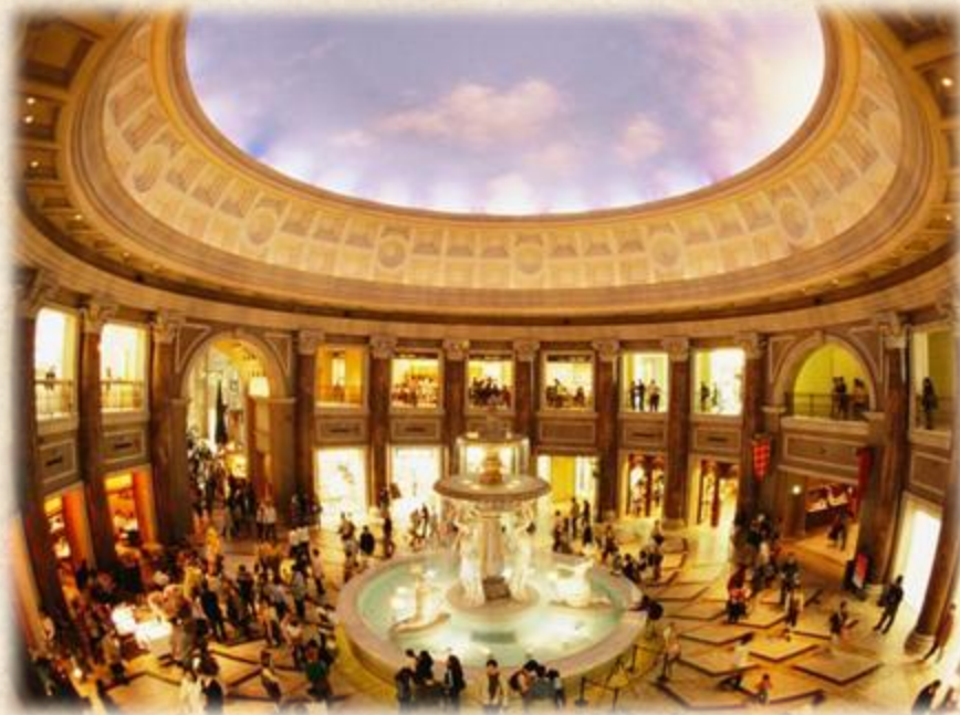
Venus Fort Shopping Center (Tokyo)

Wizerunek, logo, marka – wyobrażenia otoczenia o organizacji ( image )