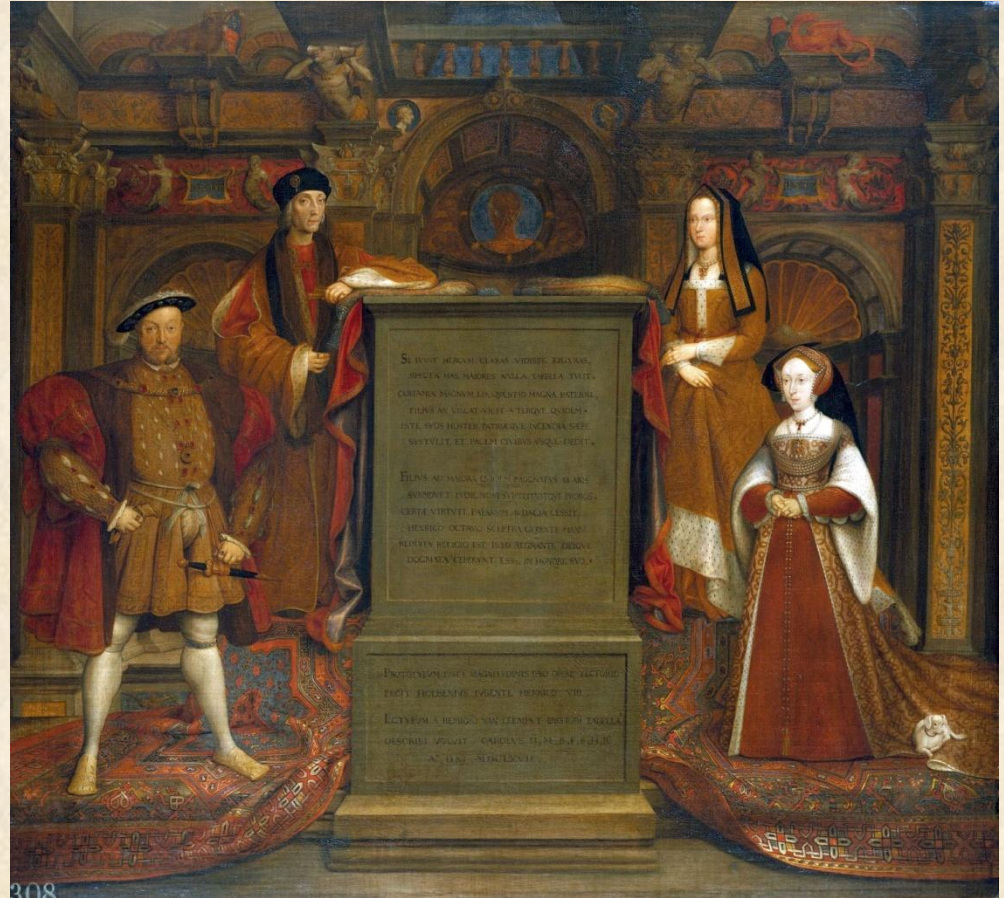
Kopia Whitehall Mural , 1667. Remigius van Leemput, za Holbeinem.

Rzeczy i przestrzeń mają symboliczne znaczenie dla ludzi, np. jako symbole prestiżu i w tej roli wchodzą w interakcje z postaciami i strukturami społecznymi, tworząc znaczenia takie jak władza, sukces, potęga (lub wręcz przeciwnie)