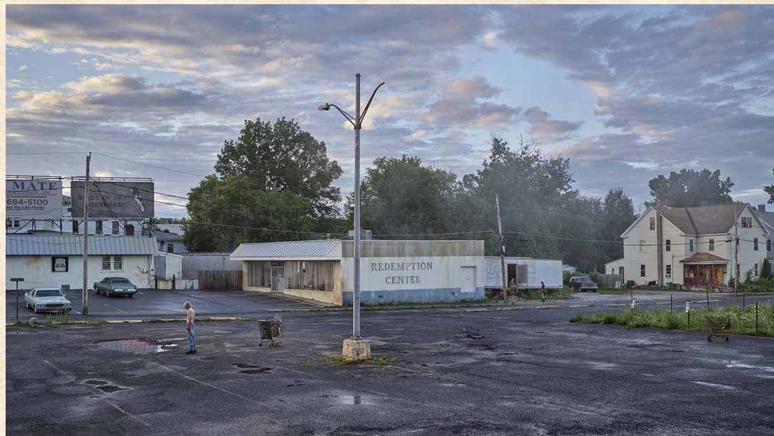
Gregory Crewdson, Redemption Center