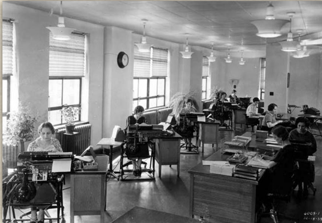
1933: niski status pracownika biurowego, praca „taśmowa” (czasami dosłownie)